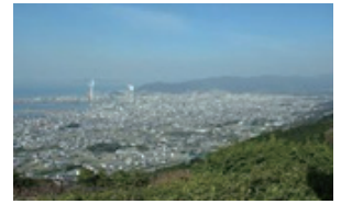
産業の集積/製紙産業