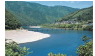
豊かな自然・安らぎの住環境

四国の底力 GDPはニュージーランドやベトナムに匹敵 総生産14兆377億円 人口3,909,756人(2012年)