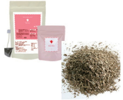
"Product Name: Jujua Guava Tea"